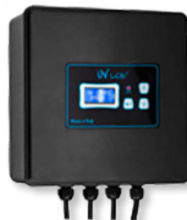
LCD 2 (PLUS)